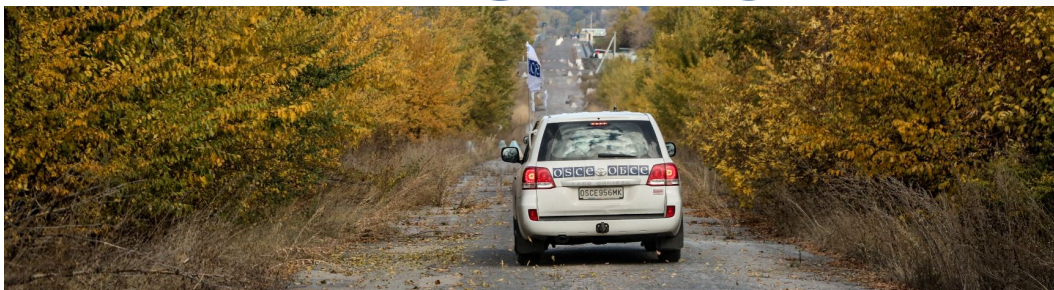
Патруль СММ на дороге в Луганской области