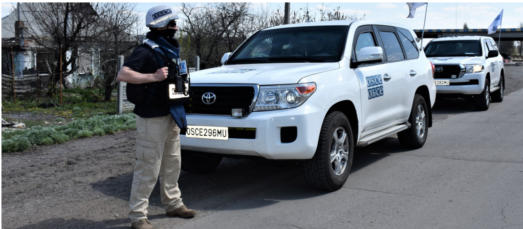
Патруль СММ неподалік від Донецької фільтрувальної станції в Донецькій області