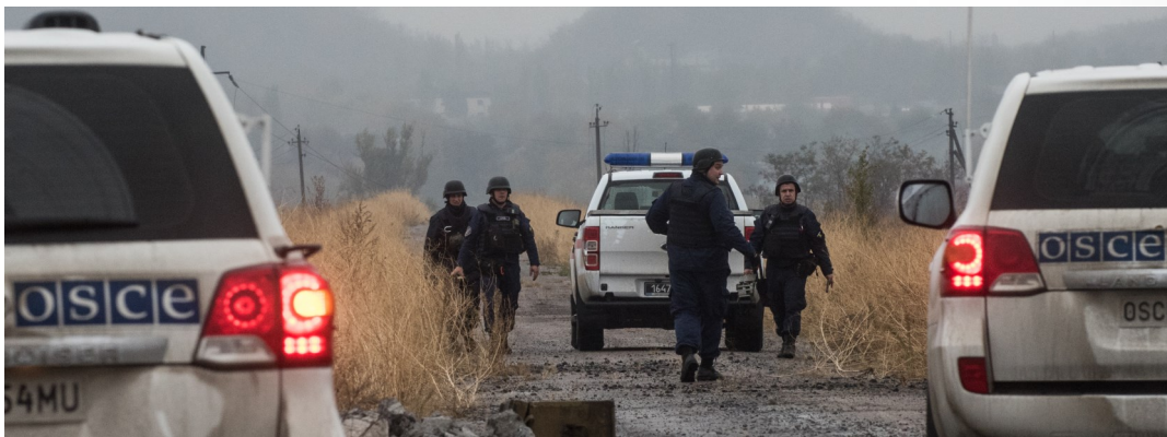
Роботи з розмінування поблизу Мар'їнки, Донецька область