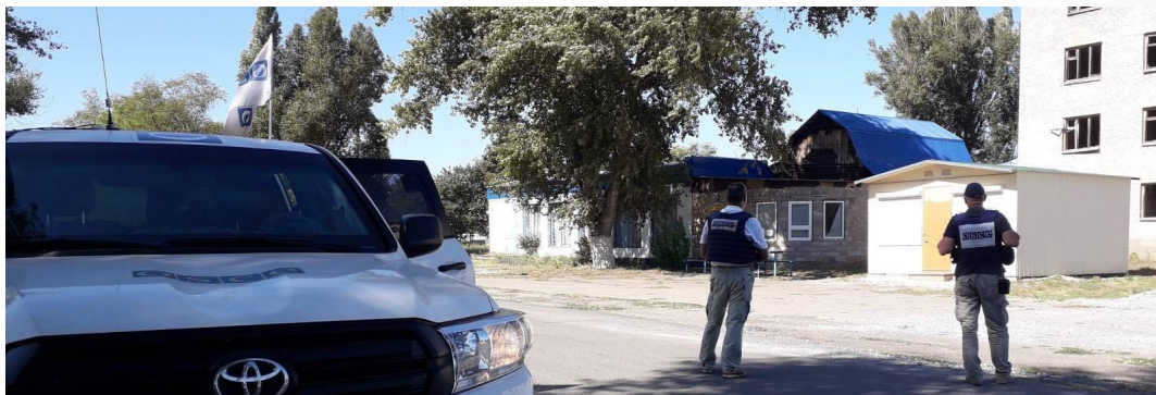
Спостерігачі СММ у Лебединському Донецької області (ФОТО: ОБСЄ/Анна Андрусенко)