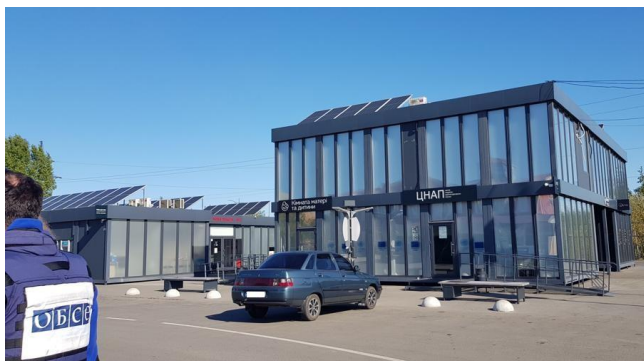
Модульный центр предоставления административных услуг на КПВВ у подконтрольного правительству Счастья Луганской области, октябрь 2021 г.

В течение отчетного периода наблюдатели фиксировали проведение строительных работ в пунктах пропуска возле Золотого и в районе Счастья, в частности, на КПВВ и на соответствующих блокпостах вооруженных формирований 48 . СММ отметила, что КПВВ возле Золотого и в Счастье были открыты с ноября 2020 года, однако соответствующие блокпосты вооруженных формирований южнее участка разведения в районе Золотого и в 3 км к юго-востоку от моста в Счастье по-прежнему были закрыты.