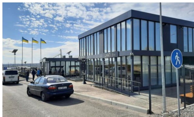
Модульные центры предоставления административных услуг на КПВВ вблизи подконтрольного правительству Новотроицкого Донецкой области, октябрь 2021 г.

В течение отчетного периода Миссия отметила, что на КПВВ в Счастье и возле Новотроицкого установили 2 модульных центра предоставления административных услуг, которые открылись 10 ноября и 16 декабря 2020 года соответственно. Данные центры — это пространство, где в одном месте гражданские лица могут получить административные, медицинские и другие виды услуг, а также посетить санитарные помещения. В декабре 2020 года Министерство по вопросам реинтеграции временно оккупированных территорий объявило о том, что на всех КПВВ вдоль линии соприкосновения будут обустроены подобные центры предоставления административных услуг 47 . Вне отчетного периода (в октябре 2021 года) СММ зафиксировала развертывание строительных работ по сооружению модульного центра предоставления административных услуг на КПВВ в Станице Луганской.