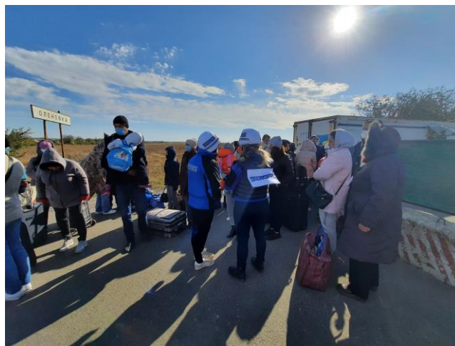
Сотрудники СММ ОБСЕ беседуют с мирными жителями на соответствующем блокпосте вооруженных формирований у неподконтрольной правительству Оленовки Донецкой области, октябрь 2021 г.

Кроме этого, как объясняли гражданские лица, иногда было сложно выйти на связь с вооруженными формированиями, чтобы получить «разрешение» на пересечение. Некоторые рассказали, что указанные телефонные номера не работали, если звонить из подконтрольных правительству районов, и в связи с этим планировать пересечение линии соприкосновения было невозможно.