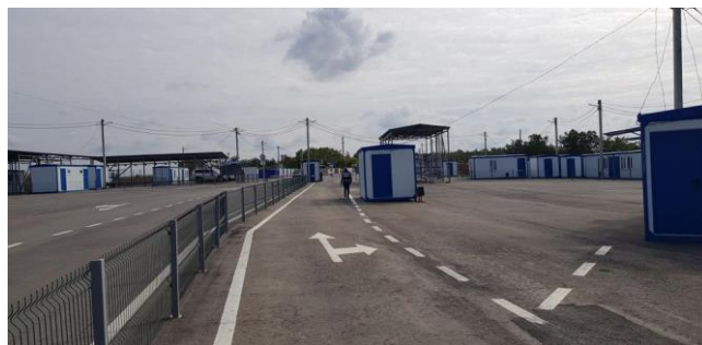
Соответствующий блокпост вооруженных формирований около неподконтрольной правительству Веселой Горы в Луганской области, октябрь 2021 г.

Поскольку в течение отчетного периода соответствующие блокпосты вооруженных формирований оставались закрытыми, Миссия не смогла констатировать наличие вышеперечисленных сервисов путем непосредственного мониторинга.