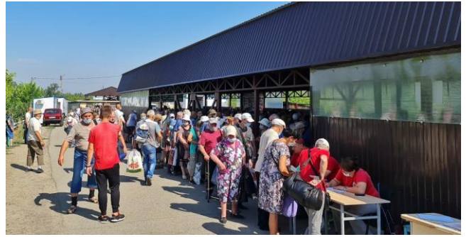
Гражданские лица пересекают соответствующий блокпост вооруженных формирований южнее моста у Станицы Луганской в Луганской области, август 2021 г.

Снятие средств и получение пенсий по-прежнему были одними из основных причин, почему люди хотели пересечь линию соприкосновения 29 . 18 мая 2021 года на соответствующем блокпосте вооруженных формирований вблизи Станицы Луганской мужчина (60–69 лет) рассказал наблюдателям, что он следовал в подконтрольные правительству районы, чтобы требовать от органов власти выплаты пенсии за полтора года. Он объяснил, что не мог пройти