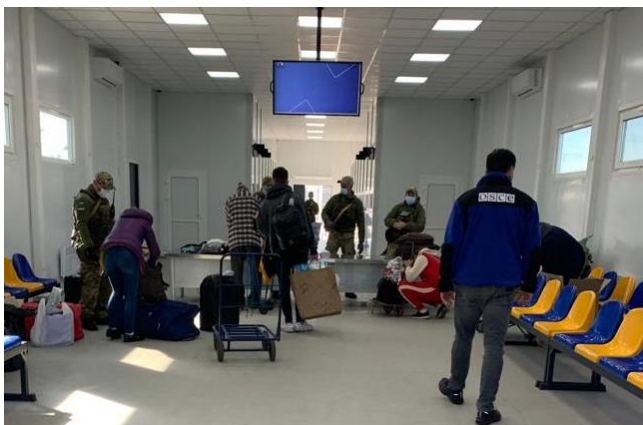
Мирные жители на КПВВ возле подконтрольной правительству Станицы Луганской в Луганской области, октябрь 2021 г.

Мирные жители рассказывали наблюдателям, что частичное закрытие линии соприкосновения и вышеизложенные требования негативно сказались на том, как часто они предпринимали попытки пересечь ее, либо вынуждали их полностью отказаться от пересечения. В результате общее количество пересечений уменьшилось на 95% по сравнению с периодом с ноября 2018 года до сентября 2019 года. В свою очередь для многих гражданских лиц это означало, что они по-прежнему не могли видеться со своими семьями, поддерживать контакты с общинами, обеспечивать себя средствами к существованию, а также получать базовые услуги (например, пенсию, лечение и образование) и основные акты регистрации гражданского состояния (например, свидетельства о рождении, смерти и браке).