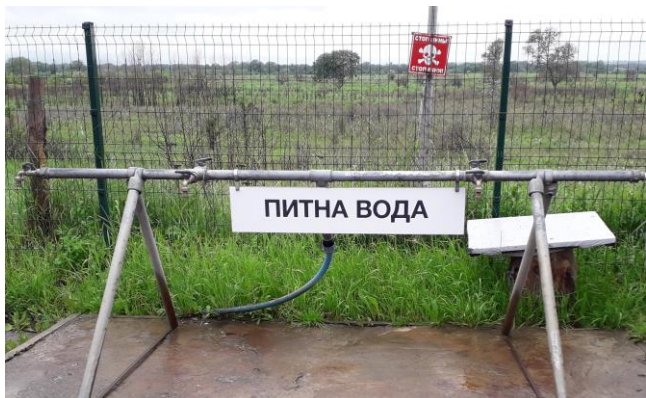
Предупреждающий знак о минной опасности красного цвета непосредственно за трубопроводом с питьевой водой у КПВВ в подконтрольной правительству Станице Луганской в Луганской области, июнь 2021 г.

Несмотря на то, что на заседании Трехсторонней контактной группы 22 июля 2020 года была достигнута договоренность о мерах по усилению режима прекращения огня, вступивших в силу 27 июля