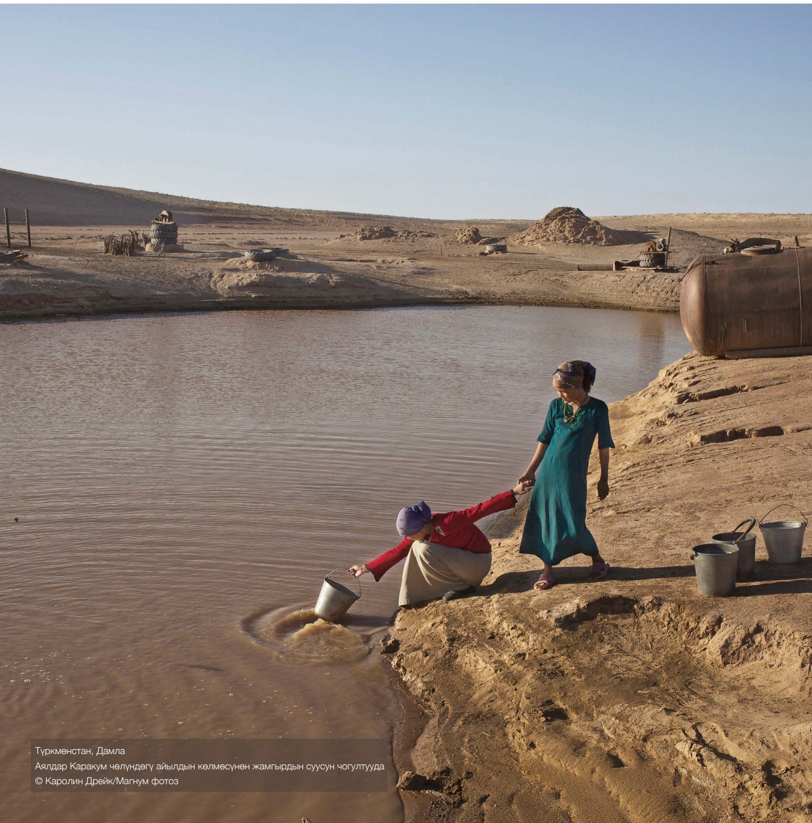
Түркмөнстан, Дамла Аялдар Каракум чөлүндөгү айылдын көлмөсүнөн жамгырдын суусун чогултууда