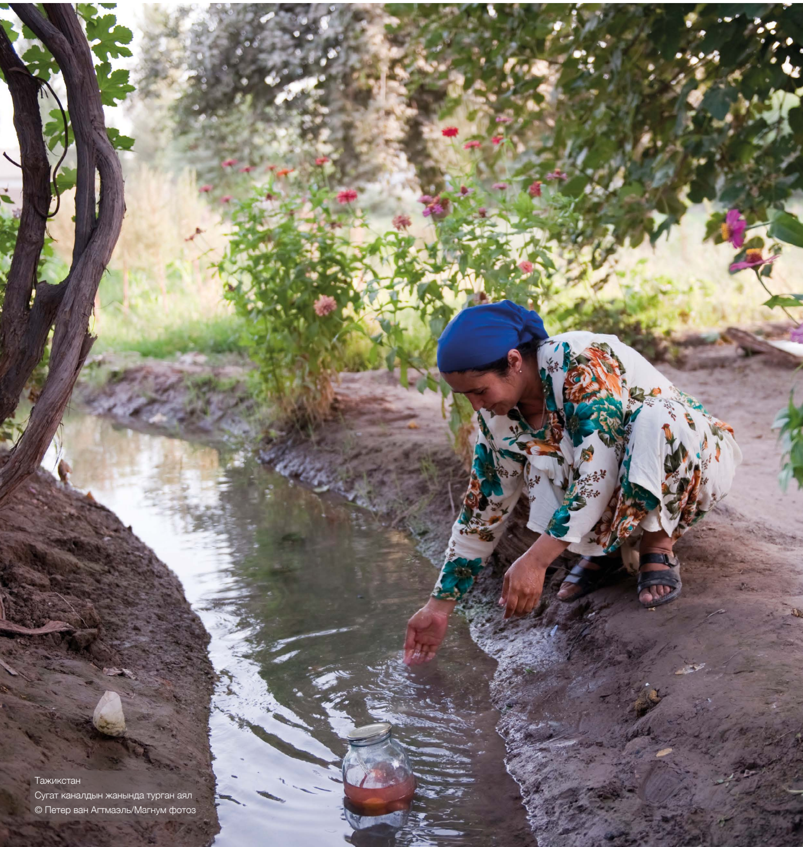
Тажикстан Сугат каналдын жанында турган аял