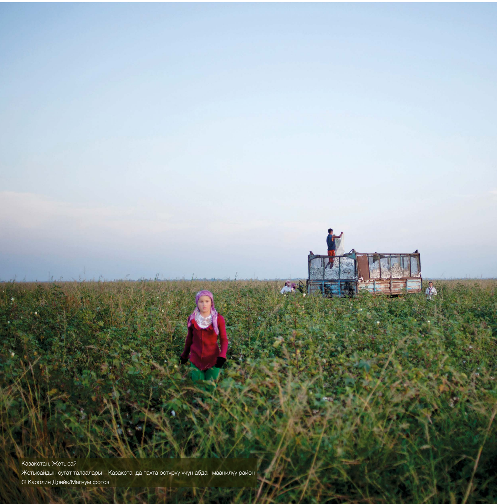
Казакстан, Жетысай Жетысайдын сугат талаалары – Казакстанда пахта өстүрүү үчүн абдан маанилүү район