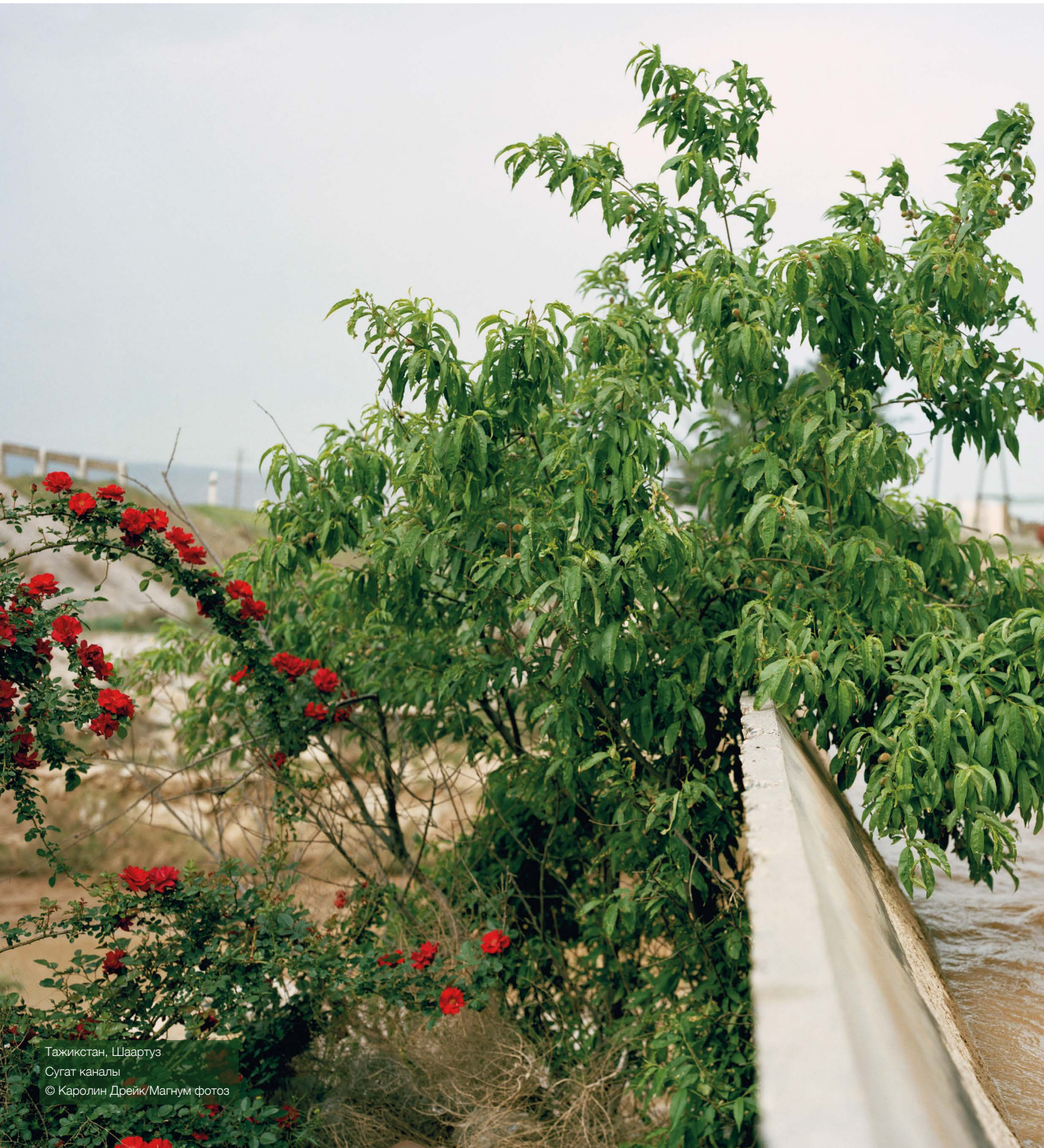
Тажикстан, Шаартуз Сугат каналы