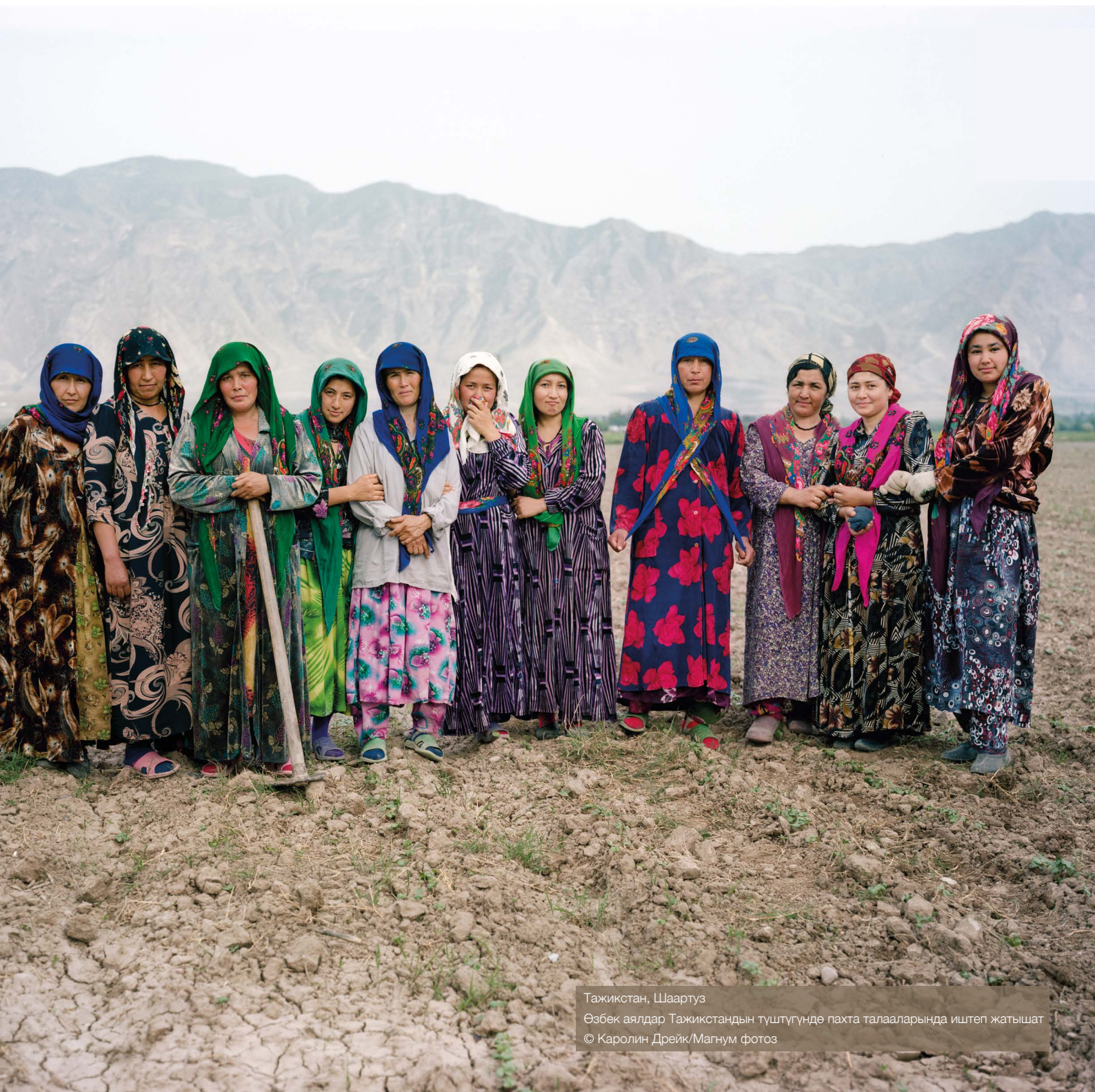
Тажикстан, Шаартуз Өзбек аялдар Тажикстандын түштүгүндө пахта талааларында иштеп жатышат