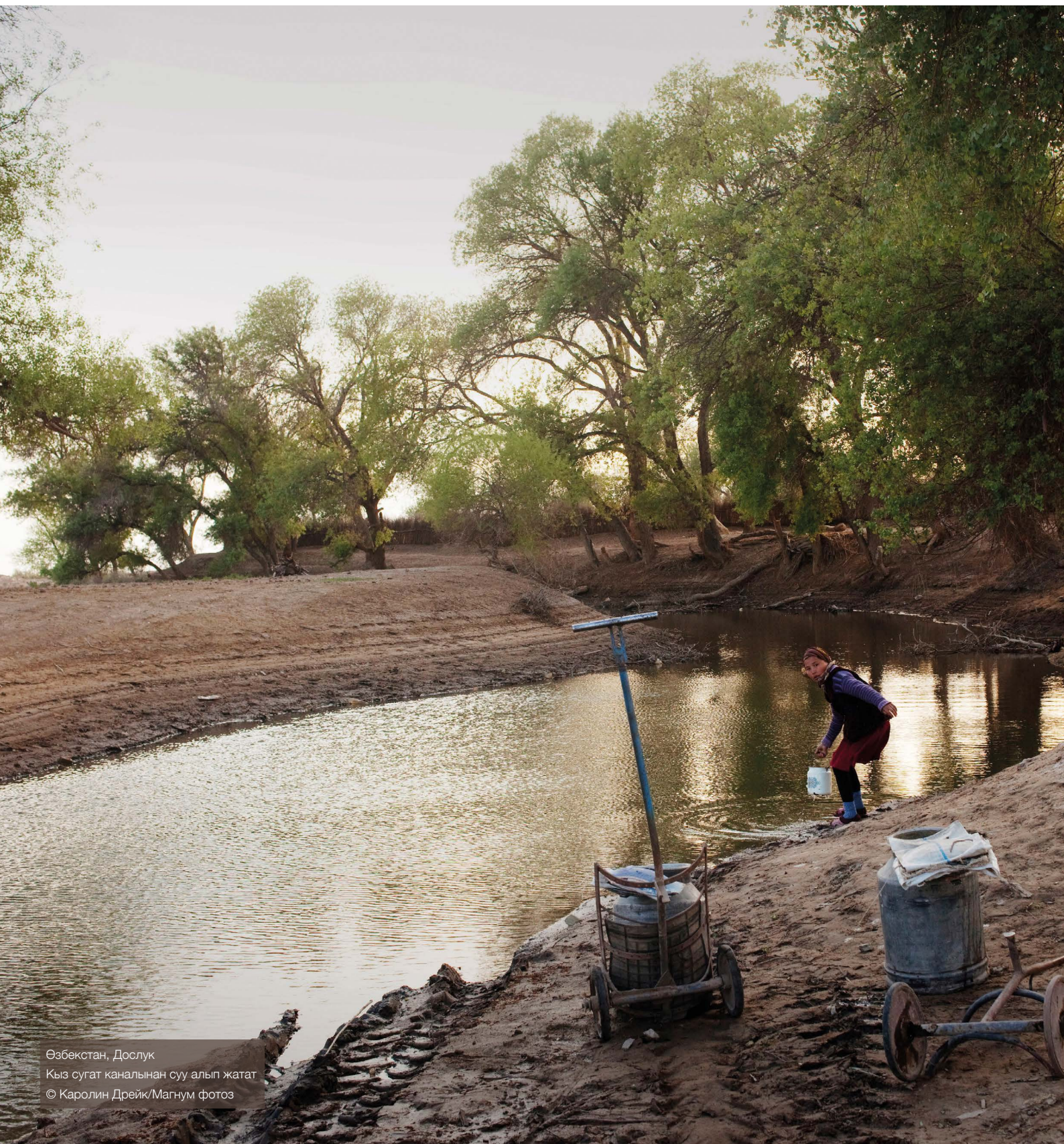
Өзбекстан, Дослук Кыз сугат каналынан суу алып жатат