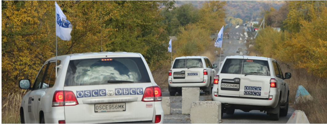
Патруль СММ поблизу Золотого в Луганській області