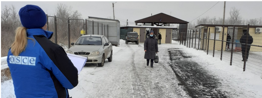
Наблюдательница СММ на контрольном пункте въезда-выезда в Станице Луганской, Луганская область