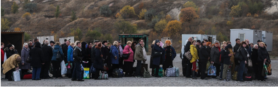
Цивільні особи в черзі на КПВВ «Новотроїцьке» у Донецькій області