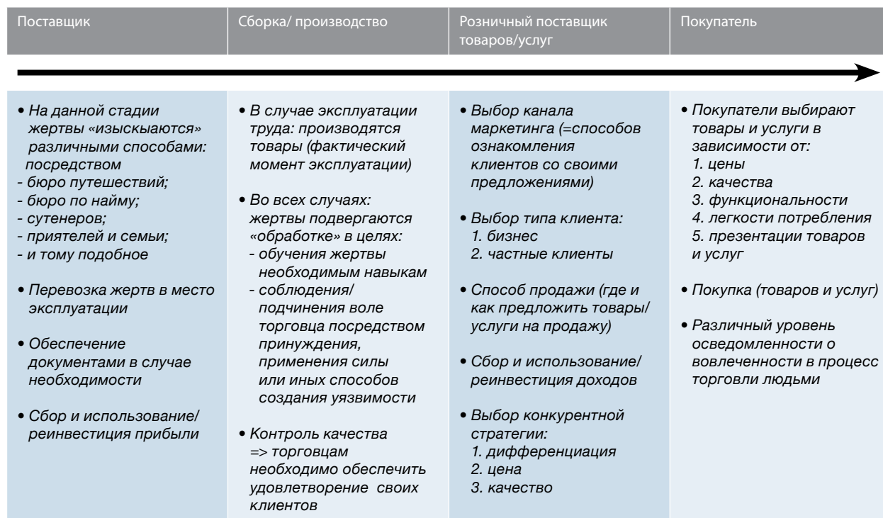
Диаграмма 2: Базовая модель цепи поставок в торговле людьми

Цепь поставок в торговле людьми представлена ниже на диаграмме 2.