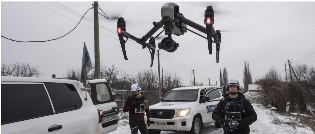
Наблюдатель СММ управляет полетом БПЛА в Донецкой области