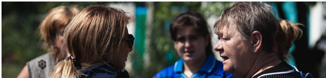
Співробітниця СММ спілкується з цивільним населенням у Луганській області