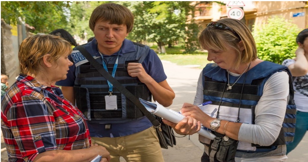
Наблюдатели СММ во время патрулирования в Донецкой области