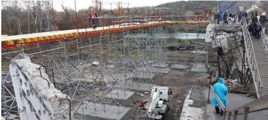
Триває спорудження обхідного мосту поблизу Станції Луганської