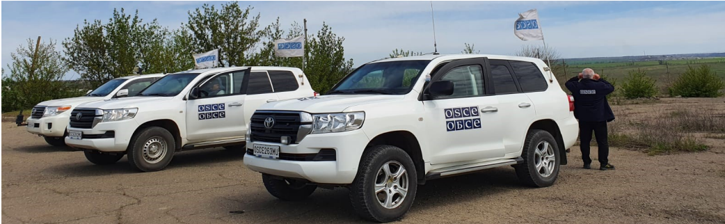
Патруль СММ поблизу Орлівського Донецької області