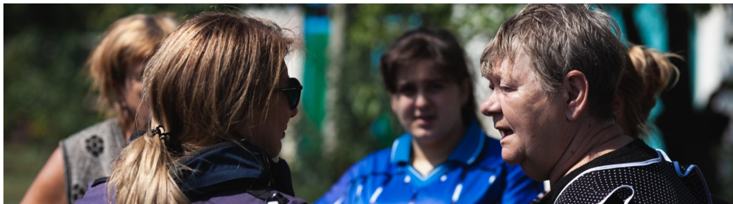
Сотрудница СММ общается с гражданским населением в Луганской области