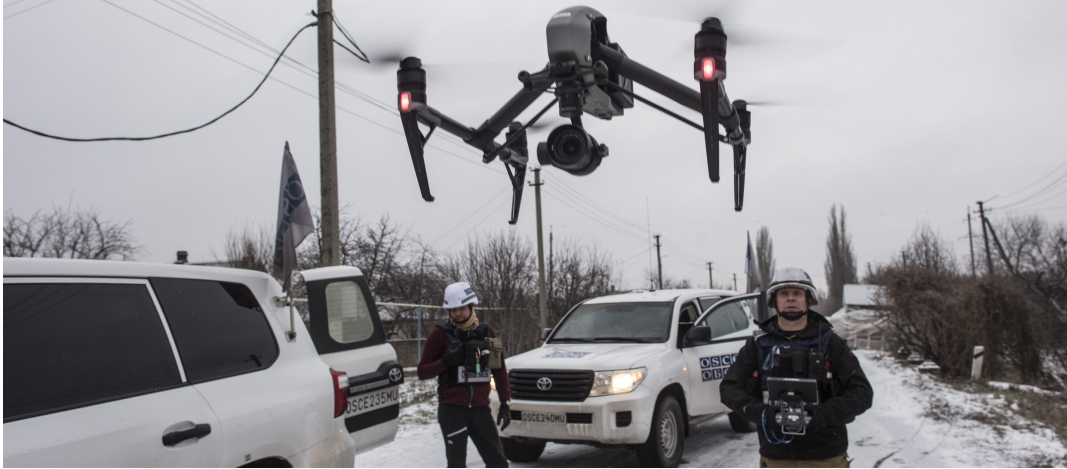
Спостерігач СММ керує польотом БПЛА у Донецькій області