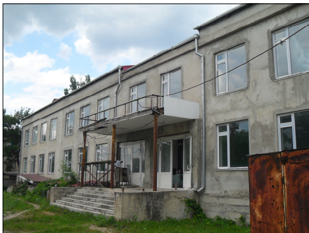
Una din clădirile școlii de pe strada Gagarin 14 din Rîbnița, construită cu sprijinul financiar al Ministerului Educației al Republicii Moldova

Scurt istoric. Înainte de anul 1983 exista doar o singură școală moldo-rusă în Rîbnița. În 1989 în Rîbnița a fost deschisă o nouă școală, școala nr. 12, în clădirea grădiniței nr. 13, care a devenit rapid insuficientă ca spațiu datorită numărului mare de elevi. 74