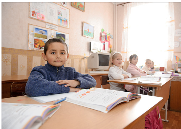
Elevii de la Liceul Teoretic “Lucian Blaga” din Tiraspol

Problema coordonării/aprobării programului de învățământ a fost una din cele mai sensibile aspecte în cadrul negocierilor privind problema școlilor. Cu toate acestea, în alte momente, această problemă a fost discutată în profunzime și s-a ajuns la compromisuri.