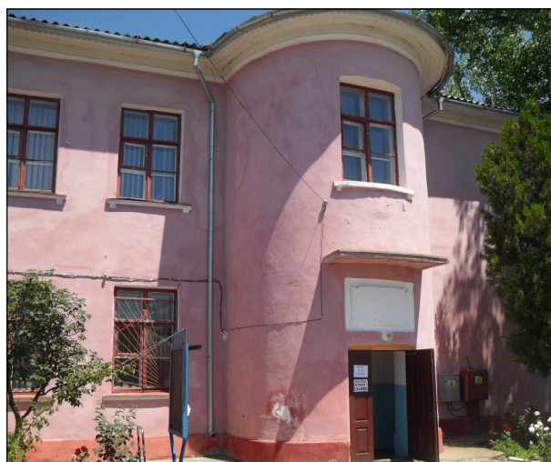
Liceul Teoretic “Lucian Blaga” din Tiraspol

Scurt istoric. Lecțiile de limbă moldovenească în grafia latină s-au început în anul 1989 în cadrul unei școli ruso-moldovenești din Tiraspol după adoptarea Legii privind limbile RSS Moldovenești. La 1 septembrie 1991, administrația orașului Tiraspol a adoptat o decizie prin care a fost fondată prima școală cu predare în limba moldovenească (cu grafia latină) din Tiraspol, școala nr. 20.