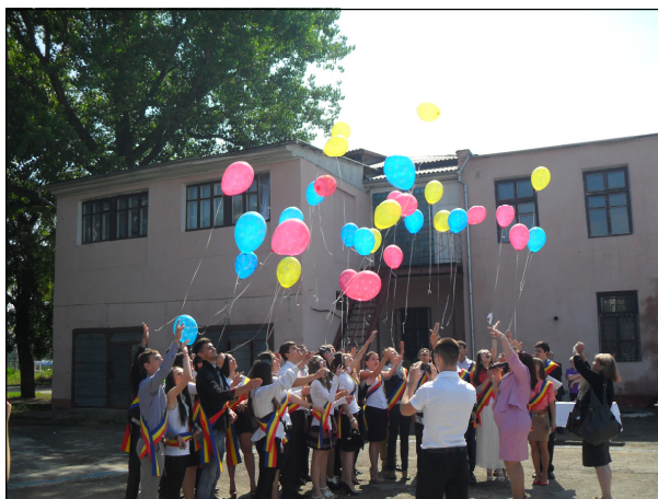
Sărbătoarea "Ultimului Sunet" desfășurată la Liceul Teoretic "Lucian Blaga" din Tiraspol

Sărbătorile "Primul Sunet" și "Ultimul Sunet" sunt evenimente tradiționale în școlile din majoritatea țărilor post-sovietice, inclusiv în Republica Moldova, și de obicei acestea includ interpretarea imnului național și arborarea drapelului național. Aceste ceremonii au loc la începutul și la sfârșitul anului școlar (1 septembrie / 31 mai). Toate cele opt școli cu predare în grafia latină desfășoară aceste ceremonii cu diferite grade de imixtiune din partea autorităților. Cele două școli situate pe malul stîng al teritoriului controlat de Guvernul Republicii Moldova și școala din Rîbnița nu raportează careva probleme, însă celelalte școli raportează despre faptul că ele sunt avertizate în mod regulat de către autoritățile locale și sunt împiedicați de către miliția locală să arboreze drapelul Republicii Moldova și să