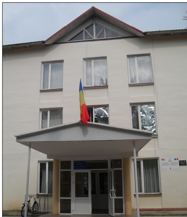
Liceul Teoretic “Ștefan cel Mare și Sfânt” (Grigoriopol/Doroțcaia)

Scurt istoric. Școala cu predare în limba moldovenească nr. 1 din Grigoriopol, similar altor școli din RSS Moldovenească, a introdus grafia latină după anul 1989. Numărul elevilor a crescut pînă la 709 în anul școlar 2001–2002 (a se vedea tabelul 1). În 1992 școala a trecut sub jurisdicția autorităților transnistrene și a trebuit să adopte grafia chirilică. Directorul a fost concediat.