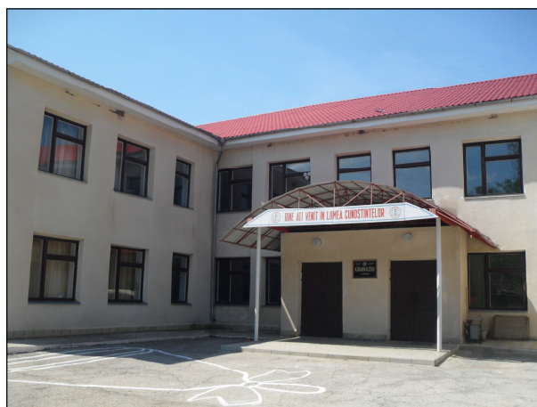
Gimnaziul din Roghi

Scurt istoric. Școala din Roghi, similar cu alte școli din RSS Moldovenească, a introdus grafia latină după anul 1989. În anul 1991 noua clădire pentru școală a fost aproape finisată, cu finanțarea asigurată de Guvernul Moldovei. Totuși, în acel an școala a fost transferată sub jurisdicția autorităților transnistrene. Noile autorități de facto au finisat construcția clădirii, însă de asemenea au introdus grafia chirilică în școală. Părinții și profesorii au protestat, însă autoritățile au concediat directorul și au menținut grafia chirilică în școală.