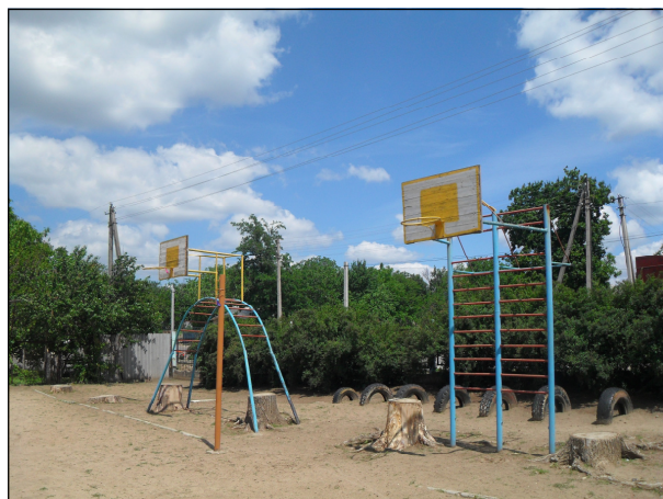
Teren de joacă de la gimnaziul din Corjova

Scurt istoric. Corjova este un sat de pe malul stîng al râului Nistru, ce a făcut față unor lupte crîncene în cadrul conflictului din 1992. Jurisdicția asupra satului este disputată între Părți și în prezent. Autoritățile de facto transnistrene consideră Corjova ca fiind o suburbie a orașului Dubăsari, controlat de Transnistria, cum era în perioada sovietică, iar autoritățile moldovenești consideră Corjova ca fiind un sat separat, aflat sub jurisdicția lor. În sat sunt dislocate atît forțe ale poliției moldovenești, cît și ale miliției transnistrene.