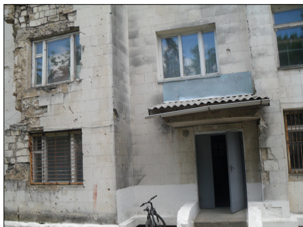
Sediul temporar al Liceului Teoretic “Mihai Eminescu” din Cocieri

Scurt istoric. Școala cu predare în limba moldovenească nr. 3 din Dubăsari, la fel ca alte școli din RSS Moldovenească, a introdus grafia latină după 1989. În 1992 școala a trecut sub jurisdicția autorităților transnistrene, a început predarea în grafia chirilică și a funcționat ca școală cu predare în limbile moldovenească și rusă. Însă, câțiva părinți și profesori încă mai doreau continuarea instruirii în baza grafiei latine. De asemenea, existau conflicte și tensiuni între elevii ce studiau în limba moldovenească și rusă din școală.