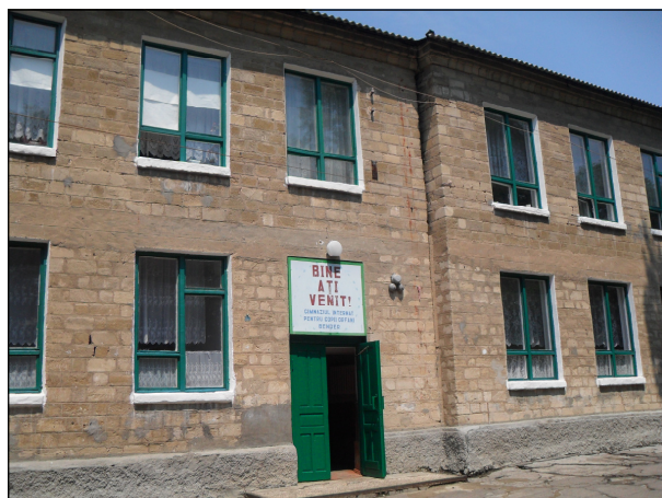
Școala de tip internat pentru copii orfani din Bender

Scurt istoric. Școala-internat pentru orfani din Bender (Internatul) a fost creată în 1957. În 1992, 1996, 2002–2003 și 2004 autoritățile transnistrene de facto au încercat să transfere școala sub jurisdicția sa. Profesorii și copiii s-au opus acestor încercări.