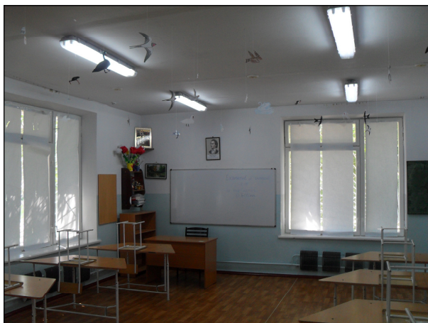
O sală de clasă din Liceul Teoretic “Alexandru cel Bun” din Bender

Scurt istoric. Școala nr. 19 din Bender a fost creată în septembrie 1988, fiind unica școală din oraș cu instruire în limba moldovenească. Școala își avea sediul în clădirea ce aparținea Școlii ruse nr. 1. După 1989, similar cu situația altor instituții de învățămînt din RSS Moldovenească, școala a început predarea în grafia latină. Aceasta a refuzat revenirea la grafia chirilică după declararea independenței de către Transnistria.