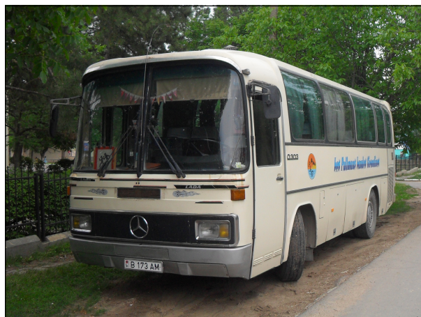
Autocarul școlii care transportă elevii Liceului Teoretic "Ștefan cel Mare și Sfânt" (Grigoriopol/Doroțcaia)

Elevii de la Liceul Teoretic "Ștefan cel Mare și Sfânt" (Grigoriopol/Doroțcaia), trebuie zilnic să treacă peste punctele de trecere transnistrene (traseul Grigoriopol / Delacău / Crasnogorca – Doroțcaia) pentru a ajunge la școala de la Doroțcaia. Ei călătoresc în autobuzele închiriate de către liceu fără controlul și examinarea documentelor.