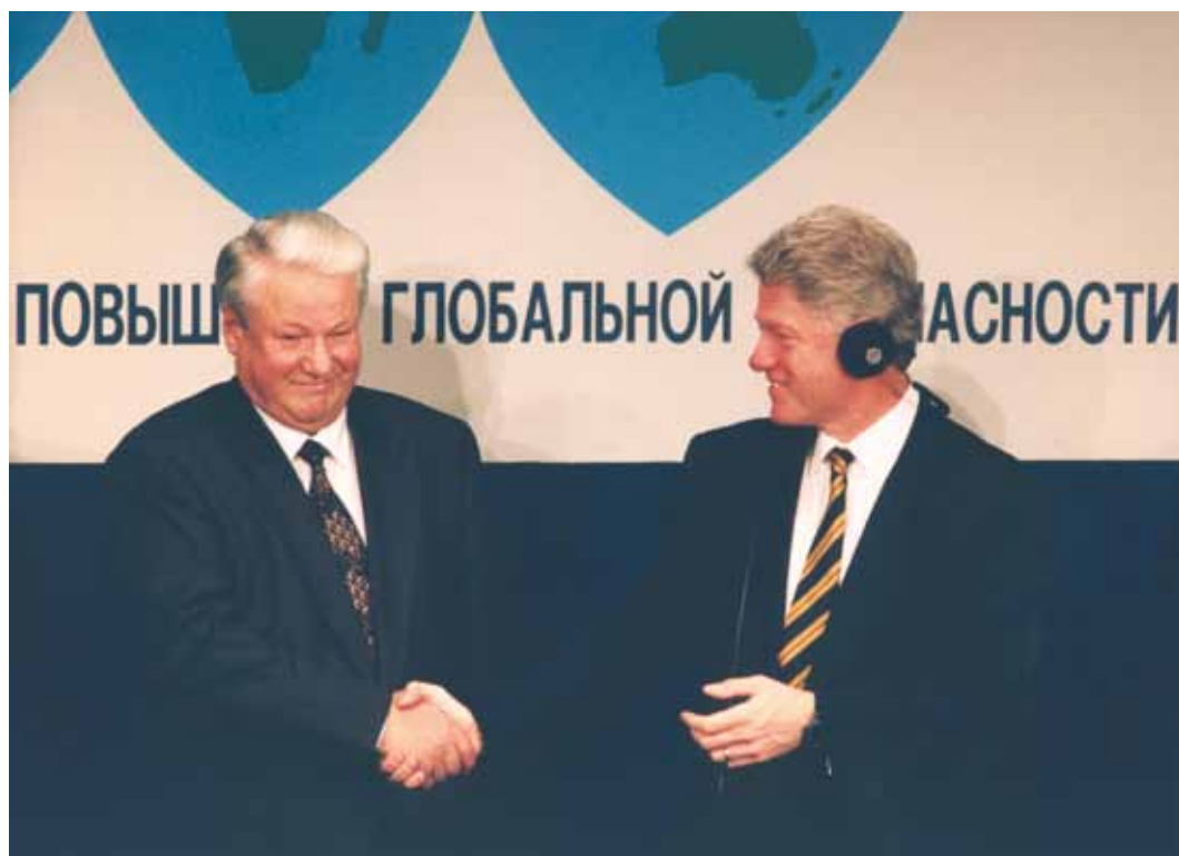
Президент Российской Федерации Борис Ельцин (слева) и президент Соединенных Штатов Америки Билл Клинтон (справа) на Встрече ОБСЕ на высшем уровне 1994 года в Будапеште

Билл Клинтон (США), Коль (Германия), Джон Мейджор (Соединенное Королевство) и Франсуа Миттеран (Франция) были обеспокоены состоянием отношений с Россией и разногласиями в НАТО по вопросу о том, как положить конец конфликту в Боснии и Герцеговине. Состоявшийся в январе 1994 года саммит НАТО подтвердил, что альянс готов принять новых членов. Расширение касалось бы «демократических государств к востоку от НАТО», исключая, впрочем, Россию. Русским стало очевидно, что их видению превращения СБСЕ в полномасштабную международную организацию, возглавляющую целую структуру соподчиненных региональных организаций безопасности, наделенную правоспособностью и имеющую свой собственный совет безопасности, включающий Соединенные Штаты Америки, Россию и Европейский союз (ЕС), не суждено воплотиться в жизнь. В Будапеште Борис Ельцин заговорил о «холодном мире». Однако российская экономика была слаба, а приверженность Ельцина взаимодействию с западными партнерами тверда. В 1994 году последние российские войска покинули Германию и прибалтийские государства. Ельцин согласился вывести 14-ю армию из Молдовы. Министры иностранных дел Великобритании и России подготовили совместную