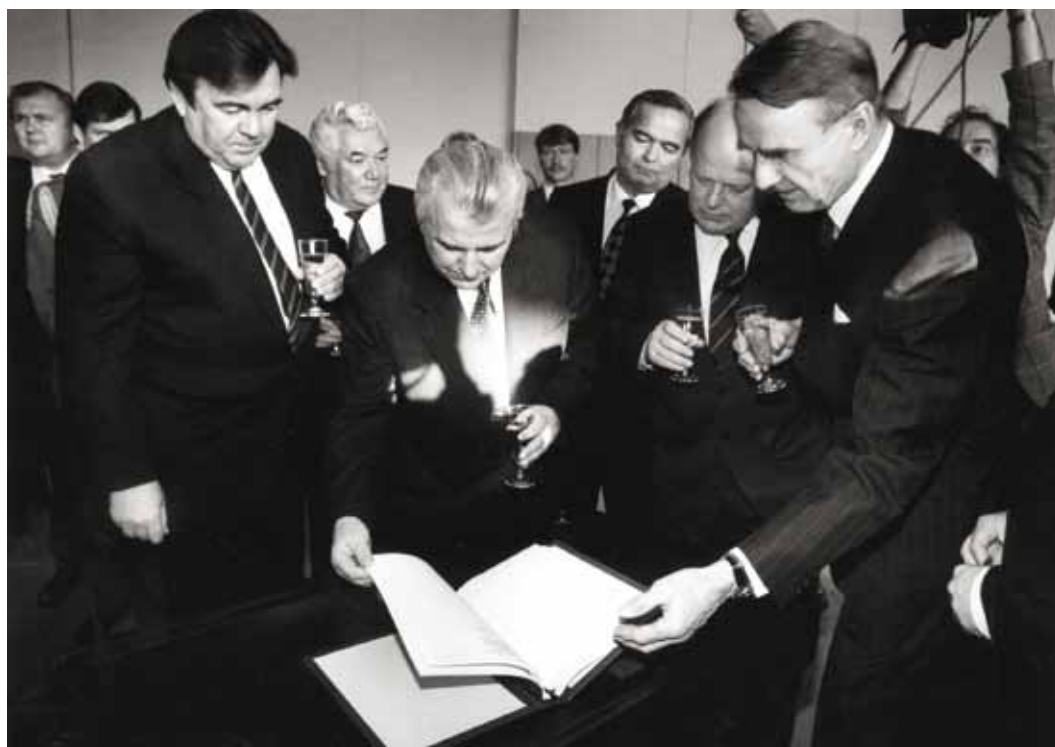
Украинский президент Леонид Кравчук перелистывает итоговый документ Встречи ОБСЕ на высшем уровне 1992 года в Хельсинках «Вызов времени перемен»

Далее в тексте отмечалось: «Стремление народов свободно определять свой внутренний и внешний политический статус увенчалось расширением сферы демократии и не так давно получило свое выражение в появлении ряда новых суверенных государств. Их полноценное участие придает новое качество процессу СБСЕ». Это новое геополитическое измерение стало очевидным, когда весной 1992 года число мест за столом переговоров пришлось увеличить на 28 (дважды по 14). Первой к первоначальным 35 государствам – участникам СБСЕ присоединилась Албания. Это произошло на берлинской встрече Совета министров в июне 1991 года. Латвия, Эстония и Литва вступили в ОБСЕ на первой дополнительной встрече Совета министров, которая была созвана в Москве накануне третьего совещания Конференции по человеческому измерению в сентябре 1991 года. На второй встрече Совета министров в конце января