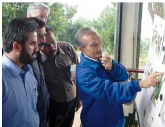
Тайский эксперт с использованием иллюстраций рассказывает должностным лицам из Афганистана и послану ОБСЕ о проекте (Фонд Мае Фах Луанг)

В 2010 году десять должностных лиц из Афганистана, в том числе заместитель министра внутренних дел по борьбе с наркотиками, приняли участие в семинаре на тему: «Борьба с незаконным культивированием растений и повышение безопасности границ и эффективности пограничного режима: практический анализ на примере Таиланда», который состоялся 24-28 января 2010 года в тайландских провинциях Чиангмай и Чианграй. Они были профинансированы за счет взносов Финляндии в Фонд партнерства, созданный в 2007 году для финансирования участия партнеров по сотрудничеству в мероприятиях ОБСЕ.