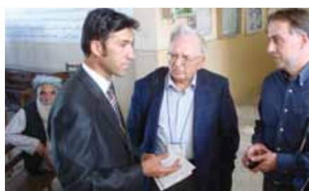
Члены группы поддержки выборов ОБСЕ/БДИПЧ разговаривают с должностными лицами на избирательном пункте в Кабуле

ОБСЕ поддерживала все выборы в Афганистане начиная с 2004 года, а в 2004, 2005 и 2009 годах выпустила доклады с рекомендациями по