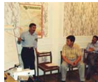
Двое таможенников из Афганистана (в форменной одежде) беседуют со своим коллегой из Туркменистана, Атамирата, Туркменистан

Это были первые проекты ОБСЕ в сфере охраны границ, осуществленные во исполнение решения по взаимодействию с Афганистаном, принятого СМИД в 2007 году, и они были полезны всем сторонам, поскольку налаженные благодаря им сотрудничество и координация действий продолжались в ходе всех последующих мероприятий в рамках этого взаимодействия.