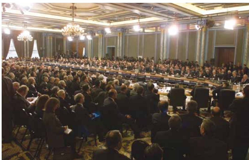
Главы государств и должностные лица, собравшиеся во дворце «Сираган» в Стамбуле, на заседании, посвященном открытию Встречи ОБСЕ на высшем уровне 18 ноября 1999 года

Кроме того, воздействие Стамбульской встречи определяется не одними только резонансными соглашениями. Подписание соглашения об адаптации ДОВСЕ стало возможным лишь после достижения трудных компромиссов между союзниками по НАТО, Россией, Грузией и Молдовой, для чего потребовалось существенно изменить положение на местах. Помимо официально утвержденной повестки дня Стамбульская встреча на высшем уровне также послужила широким форумом, на котором удалось достичь соглашений между отдельными группами государств – участников ОБСЕ; наиболее заметным из них стала сделка о строительстве трубопровода Баку – Джейхан . Кроме того, на этой встрече НПО представилась возможность вовлечь принимающую страну в открытый диалог по вызывающим обеспокоенность частным вопросам, касающимся прав человека. Сознательное решение ключевых государств-участников рассмотреть такие вопросы в контексте встречи ОБСЕ на высшем уровне содействовало укреплению роли Организации как центрального элемента архитектуры европейской безопасности, а также ее всеобъемлющей, охватывающей все измерения концепции безопасности.