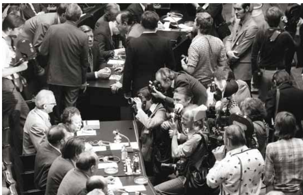
Толпа фотожурналистов на открытии Конференции по безопасности и сотрудничеству в Европе в Хельсинки 3 июля 1973 года

Тем не менее во время марафонских переговоров, проходивших с 1972 года, когда начались консультации по повестке дня и порядку проведения Совещания, по 1975 год, когда был подписан хельсинкский Заключительный акт , перед советским руководством стоял вопрос о том, готово ли оно заплатить определенную цену за успешное завершение проводившейся работы. В конечном итоге, было решено пойти на это. Оно согласилось с идеей включения в повестку