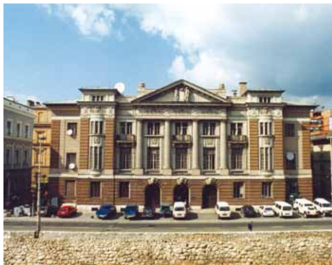
Первая штаб-квартира Миссии в Боснии и Герцеговине в деловом центре Сараево (ОБСЕ)