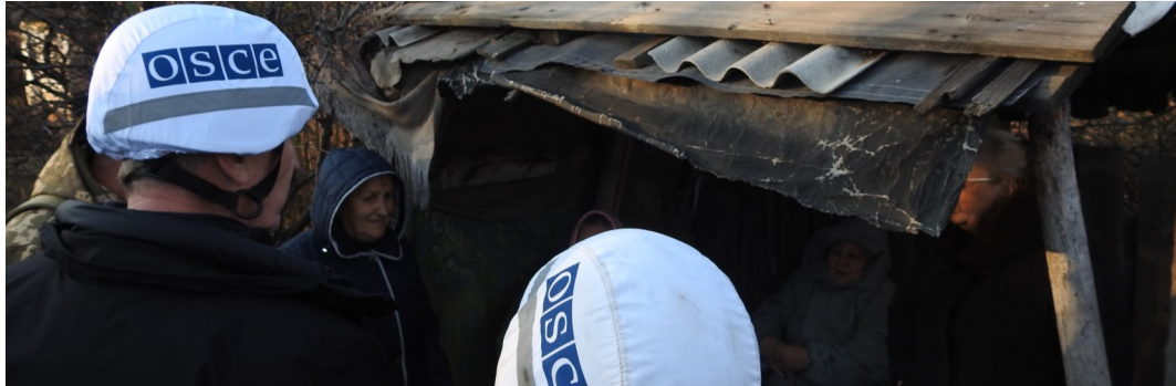
Спостерігачі СММ здійснюють патрулювання в Золотому Луганської області