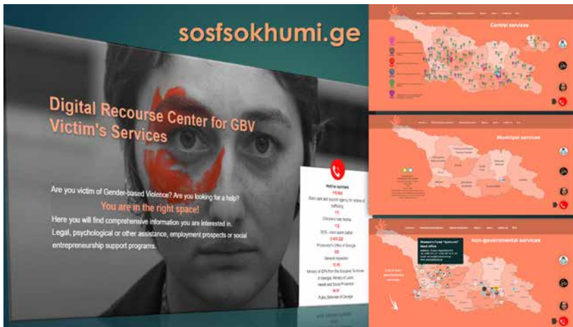
სურათი: გენდერული ნიშნით ძალადობის მსხვერპლთა მომსახურების ციფრული რესურსცენტრის მთავარი გვერდი

ოჯახში ძალადობის მსხვერპლთა პირადი წარმატების ისტორიები, რაც აქტიურად ვრცელდება სოციალური მედიის საშუალებით. გარდა ამისა, აქტიურად ხორციელდება მედია კამპანიები და საინფორმაციო შეხვედრები სხვადასხვა სოციალურ და პროფესიულ ჯგუფთან (განსაკუთრებით ქალებთან), სადაც მათ დეტალურად აცნობენ, თუ როგორ უნდა გამოიყენონ ონლაინ პლატფორმა და ასევე ეხმარებიან ციფრული უნარების განვითარებაში. პარალელურად მიმდინარეობს სოციალურად დაუცველი, ძალადობის მსხვერპლი ქალებისთვის სმარტფონების გადაცემა. ყველა ეს ღონისძიება, მნიშვნელოვნად ამარტივებს დაინტერესებული პირებისთვის ონლაინ პლატფორმაზე წვდომას.