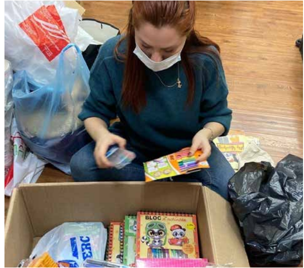
სურათები: დახმარების პაკეტების შეკრება და განაწილება სომხეთში

გამოკითხვებისა და უკუკავშირის შედეგად გაირკვა, რომ, სამწუხაროდ, ჰიგიენური საშუალებების მიწოდება არ იყო გათვალისწინებული სახელმწიფოს მიერ და არ იყო შეტანილი მხარდაჭერის პაკეტში, რადგან სახელმწიფომ ყურადღება გაამახვილა საკვებითა და თავშესაფრით უზრუნველყოფაზე. ამდენად, სახელმწიფოს მხრიდან ქალის მოთხოვნილებები სრულად არ იყო გათვალისწინებული და დაკმაყოფილებული. კერძოდ, ომში გადარჩენილი ქალებისთვის მენსტრუალური საფენებისა და საცვლების მიწოდება სახელმწიფომ სრულიად უგულებელყო.