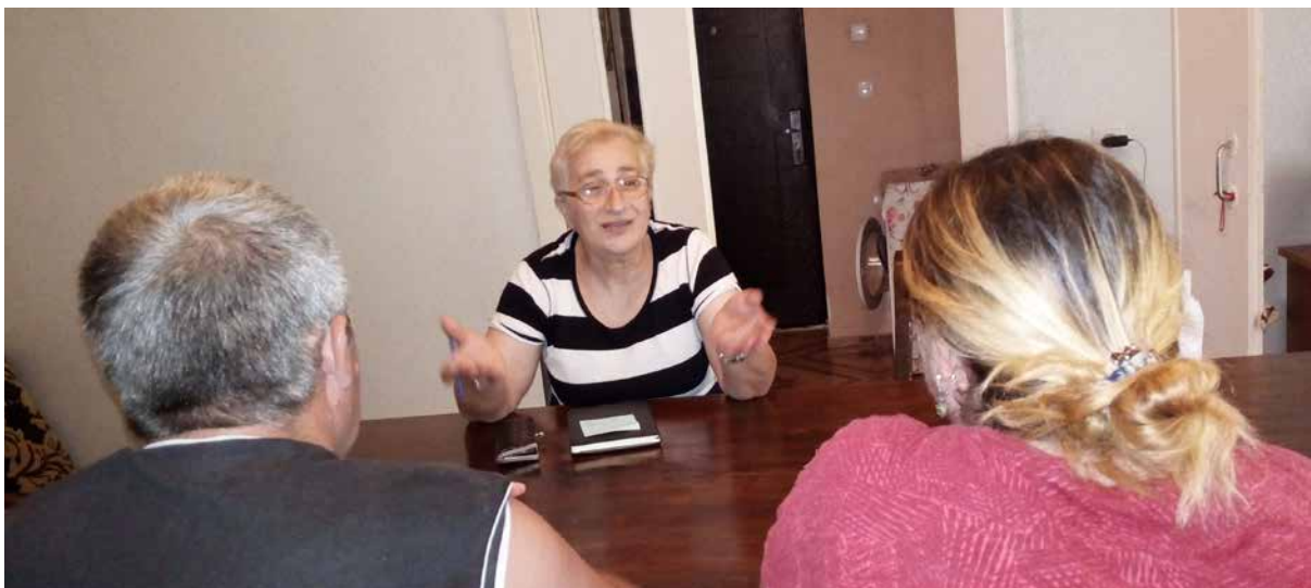
სურათი: მუშაობა წყვილთან ქალთა ფონდში სოხუმი

30 წელია ვცხოვრობთ დევნილობაში და გაურკვეველ ვითარებაში, ერთ პატარა ბინაში სამი თაობა ერთად ცხოვრობთ... ასეთ ოჯახში ყველანაირი პირობაა შექმნილი კონფლიქტის აღმოცენებისთვის. ერთ დღეს მივედი ფონდ „სოხუმის“ შეხვედრაზე. როცა კონფლიქტის სპეციალისტი ლაპარაკობდა, როგორ იქმნება ოჯახში კრიზისი, მეგონა ჩემზე ლაპარაკობდა. ძალიან შემეშინდა. ის, რაც მე უბრალო კამათი მეგონა ჩემს ოჯახში, კონფლიქტის გაჩენის სერიოზული რისკი ყოფილა. ჩემს თავს ვუთხარი: „აფხაზეთში ყველაფერი დავკარგეთ... არ მინდა