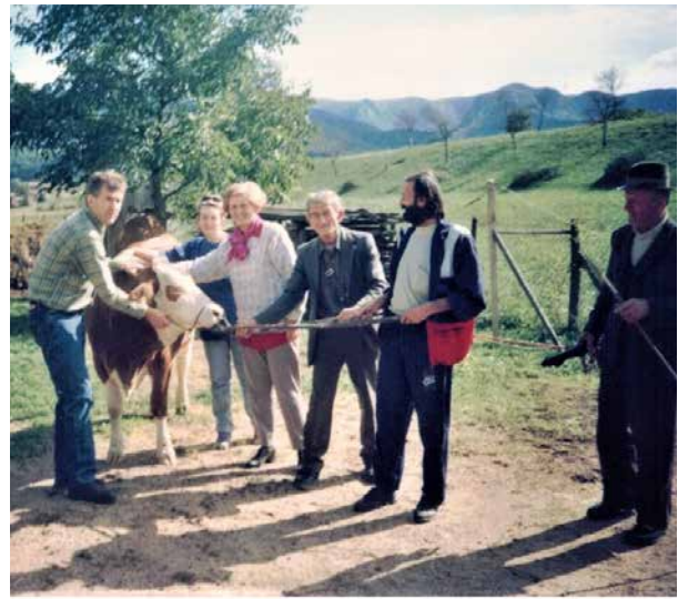
სერბსკას რესპუბლიკისა და ბოსნია და ჰერცეგოვინის ფედერაციის საზღვარი, 1997 წ. ქალთა გაერთიანებული ფონდის საქმიანობა სოფლად ქალთა ეკონომიკური გაძლიერების გასაუმჯობესებლად.

ასევე, ძალიან მნიშვნელოვანი იყო დიალოგის გამართვა ქალებს შორის ბოსნია და ჰერცეგოვინას ყველა კუთხიდან და ყველა ეთნიკური ჯგუფიდან . სხვა ქალთა ჯგუფებთან დაკავშირებამ ბოსნია და ჰერცეგოვინასი ხელი შეუწყო ქალთა ტრეფიკინგის პრევენციას, ოჯახში ძალადობაზე უკეთ რეაგირებას და მშვიდობის მშენებლობაზე მუშაობას.