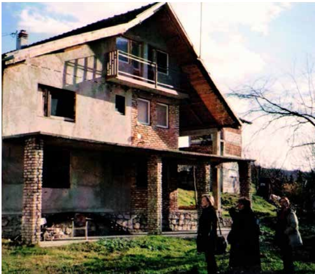
უსაფრთხო სახლი ბანია ლუკაში, 2003 წელი. ახლად შეძენილი სახლი, მოგვიანებით გადაკეთდა თავშესაფარად ძალადობის მსხვერპლი ქალებისა და ბავშვებისთვის