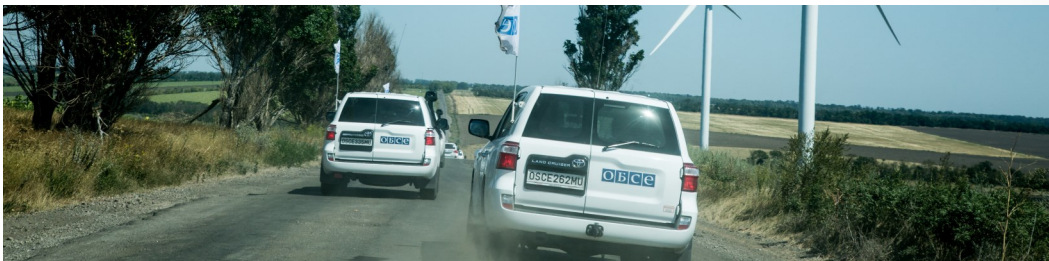
Патруль Місії в Донецькій області