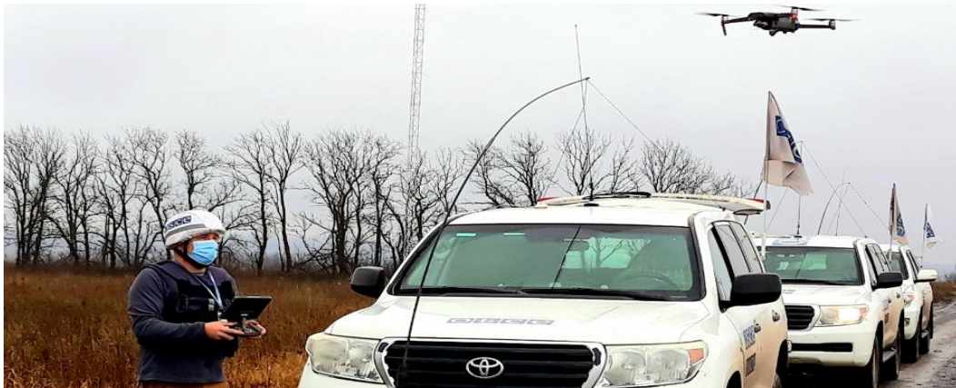
Наблюдатель СММ запускает БПЛА на участке разведения в районе Петровского в Донецкой области