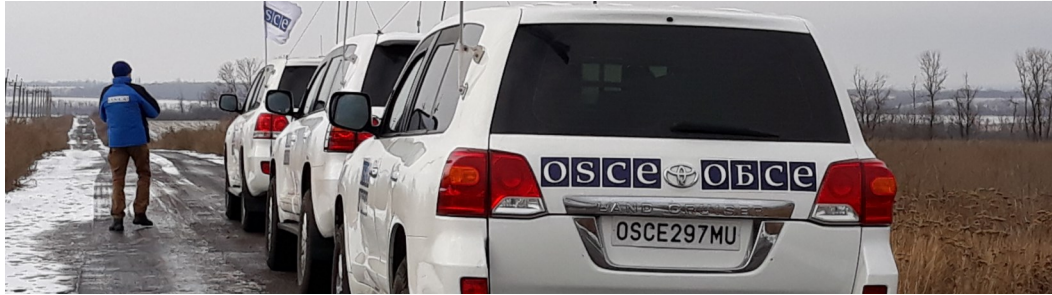
Патруль СММ поблизу Богданівки, Донецька область