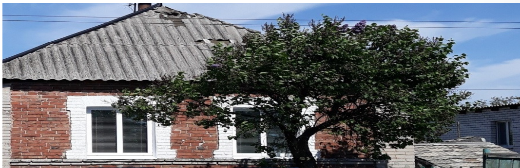
Пошкоджений від обстрілу житловий будинок в Авдіївці Донецької області