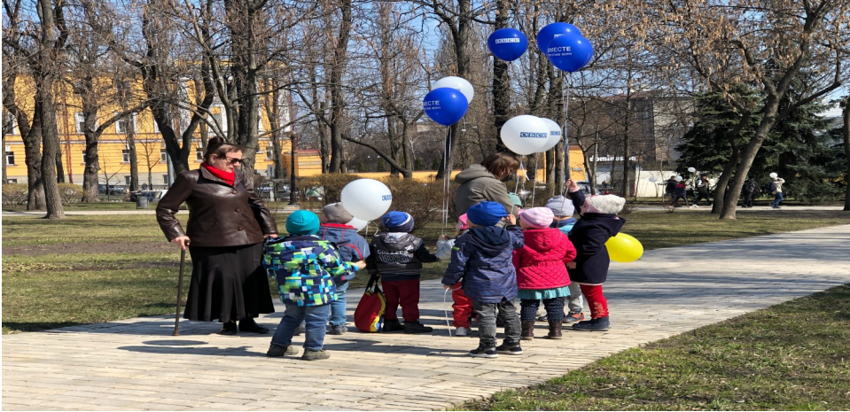
Інформаційно-просвітницький захід, організований у Києві задля підвищення рівня обізнаності про міну небезпеку