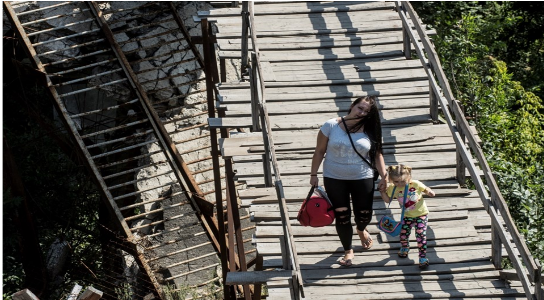
Цивільні особи на мосту у Станиці Луганській