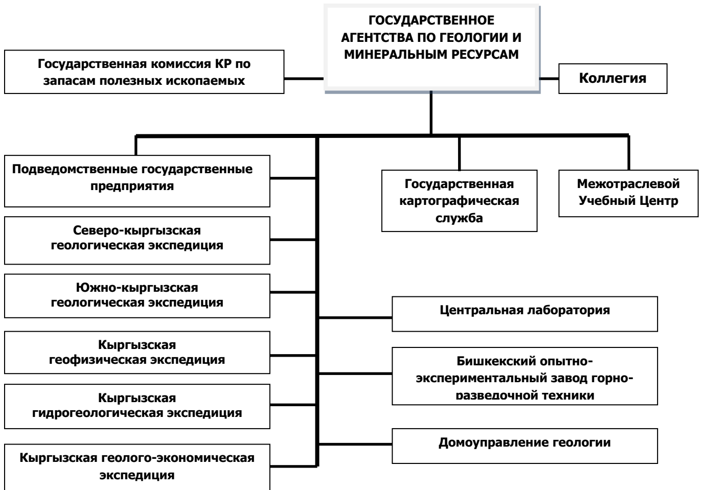
Схема 2. Структура управлений Госгеологоагентства по вопросам недропользования

Согласно статье 9 Закона КР «О недрах» МГА и МСУ в сфере недропользования вправе: