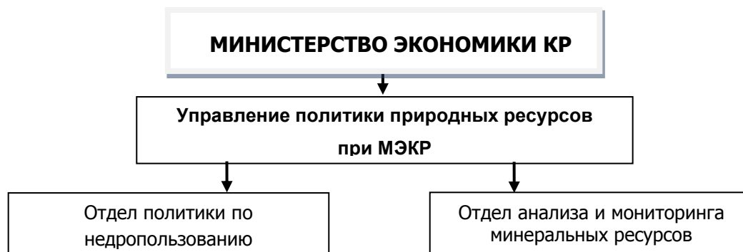
Схема.1 Структура управления Госэкоинспекции по вопросам недропользования

В рамках своих полномочий МЭКР в сфере недропользования :