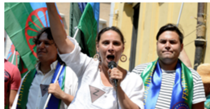
Ромская актриса и правозащитница Диана Павлович проводит демонстрацию вместе с представителями общин рома и синти перед зданием Парламента в Риме в знак протеста против нетерпимости и дискриминации и в память о 2897 рома, убитых в августе 1944 года

Антиромские преступления на почве ненависти – это уголовные преступления, мотивированные расистскими предубеждениями в отношении рома и синти , а также различных людей и групп, которые связаны с рома и синти