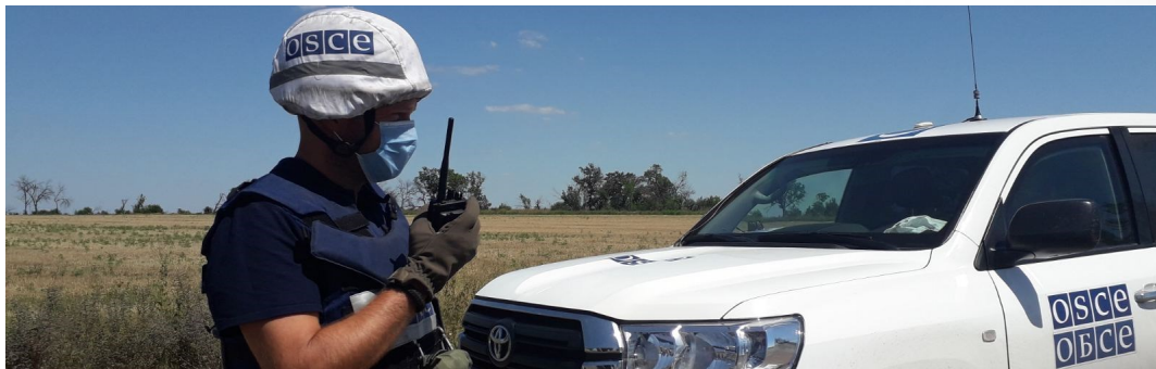
Спостерігач поблизу Бердянського, Донецька область