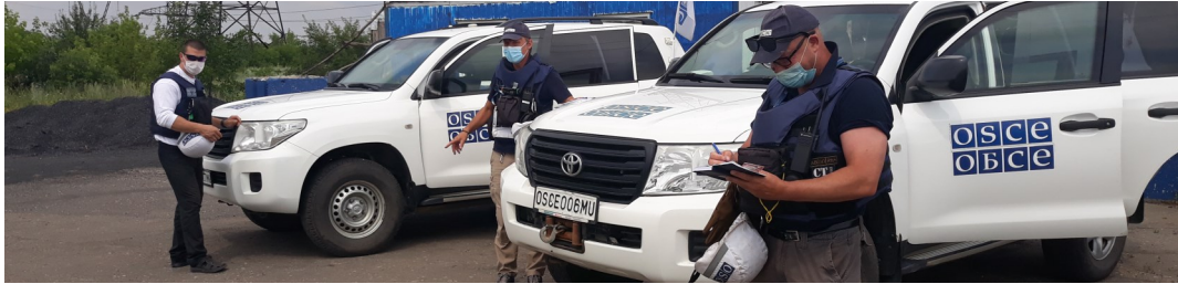
Спостерігачі поблизу ділянки розведення в районі Золотого, Луганська область