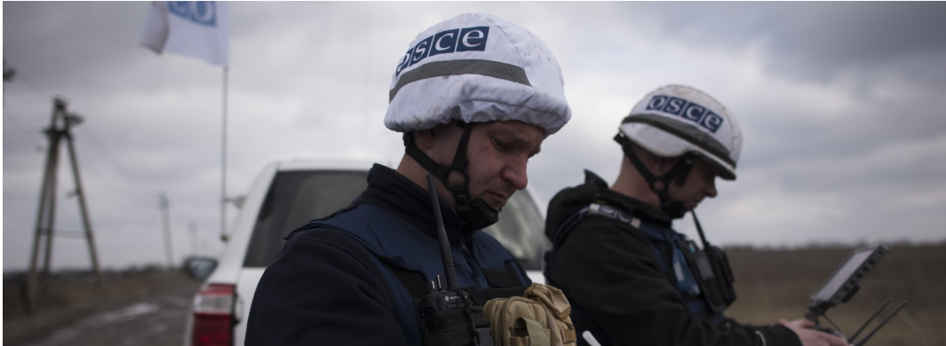
Спостерігачі СММ патрулюють біля Оленівки, що в Донецькій області